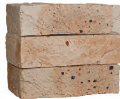
Снежная королева нюанс