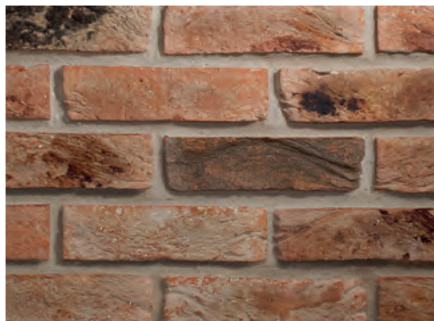
Бархан + Античный мох + Обоженная роза + Марс